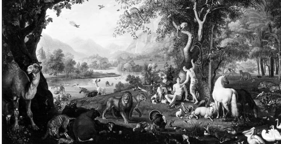
Das Paradies – der Bestimmungsort der Menschen, die in Gottes vollkommene Liebe eingehen. Wenzel, Peter: Adam und Eva im Irdischen Paradies, Vatikan