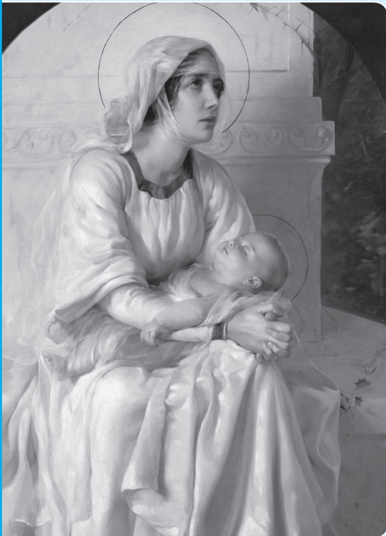
Italienische Schule des 19. Jahrhunderts: Madonna und Kind

Aktuelle Bücher, Devotionalien, CDs und DVDs