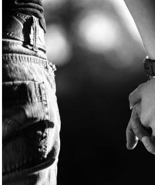
Mann und Frau sind sich ähnlich, aber doch verschieden. Sie er