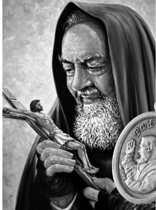
Der hl. Pater Pio († 1968) war ein stigmatizierter Kapuzinermönch, der vielen Hilfesuchenden beistand. Noch heute wird er von Millionen Menschen sehr verehrt und als Fürsprecher angerufen

Einmal traf ich eine Frau, die es sich zur Gewohnheit gemacht hatte, jeden zu verfluchen. Als ich ihr begegnete, war sie 72 Jahre alt, und sie verfluchte auch mich. Ihr Lieblingsfluch war: „Wehe dir!“ Sie sprach jeden mit diesem „Gruß“ an, sogar ihre Kinder und Enkel, die sich um