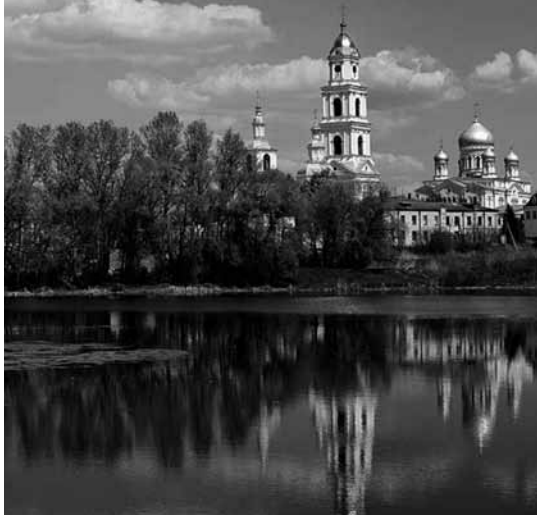
Die Reliquien des hl. Seraphim von Sarow sind in der Dreifaltigkeit gibt es viele Quellen, die mit Seraphim in Verbindung gebracht zahl von Heilungen geschahen

Als sich unser Herr Jesus Christus nach seiner Auferstehung würdigte, das Werk unseres Heils zu vollenden, sandte er den Aposteln den Hauch des Lebens, den Adam verloren hatte, und gab ihnen die Gnade des Geistes zurück. Am Pfingsttag ließ er ihnen die Kraft des Heiligen Geistes zukommen, der sie durchdrang in Form eines starken Windes; unter dem