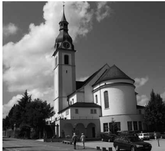
Die Kirche St. Ulrich in Neuenkirch bei Luzern (Schweiz) in deren Krypta die Gebeine des Niklaus Wolf ruhen

Über den Tod hinaus bleibt Niklaus ein Fürbitter und Beter an Gottes Thron. Sein Seligsprechungsprozess wird angestrebt, und in der Kirche, in deren Krypta sein