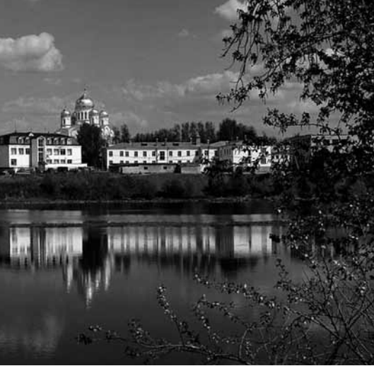
keitsbasilika von Diveevo (Russland) beigesetzt. Im Umland und von unzähligen Pilgern aufgesucht werden, da eine Viel-

Verstand. Im Gegenteil, durch unsere wachsende Verkehrtheit entfernen wir uns von der Gnade des Heiligen Geistes und werden große Sünder.