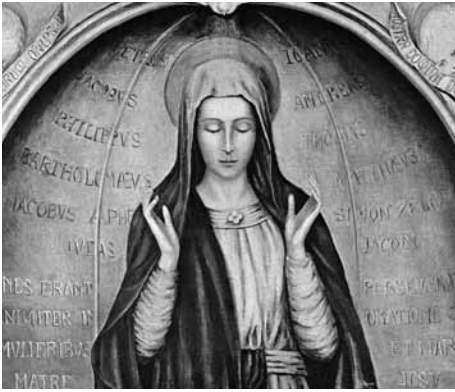
Die Gottesmutter im Abendmahlssaal beim Pfingstgebet inmitten der Jüngerschar (Our Lady of Cenacle)